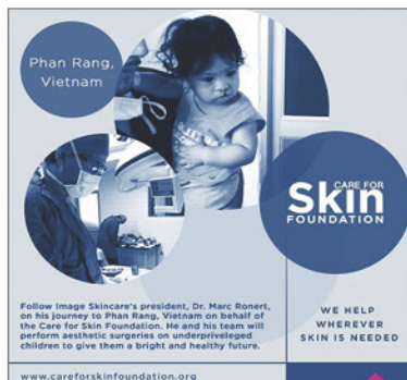
IMAGE Skincare главный спонсор Фонда «Забота о Коже» и Международной организации ReSurge.